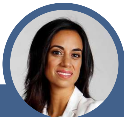
Paulina Nuñez Diputada Vicepresidenta RN

"Tenemos un sistema político en crisis. Todos los indicadores nos señalan esto y, qué duda cabe además, el plebiscito nacional es una salida institucional con participación ciudadana a esta crisis de confianza.